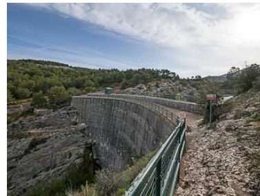
Barrage de Zola (1854)