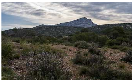
Le thym fleuri .