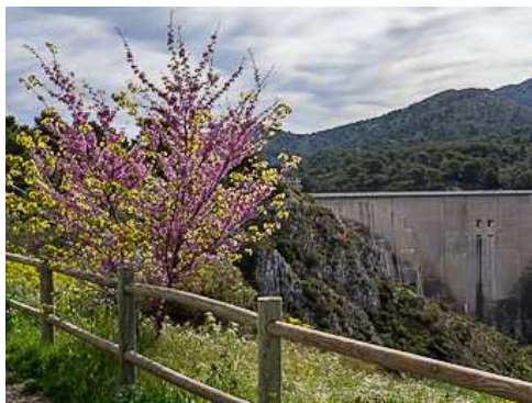
Un arbre de Judée en fleurs.

On trouve quelques plantes ou arbres spécifiques de ce milieu rocailleux comme :