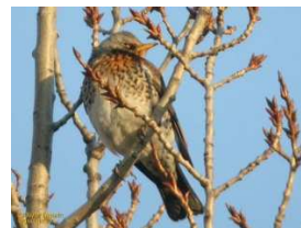
La grive Litorne