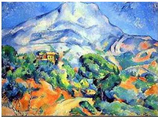
“LA MONTAGNE STE VICTOIRE” - PAUL CÉZANNE

La saint victoire et aussi mondialement connue pour les toiles de Paul Cézanne il en a fait beaucoup de 1902 à 1906 C'est un grand peintre né à Aix en Provence en 1839 et mort en 1906 . Il voulait mourir en peignant et le 15 octobre 1906 il a une pleurésie en peignant sous la pluie et meurt 8 jours après.