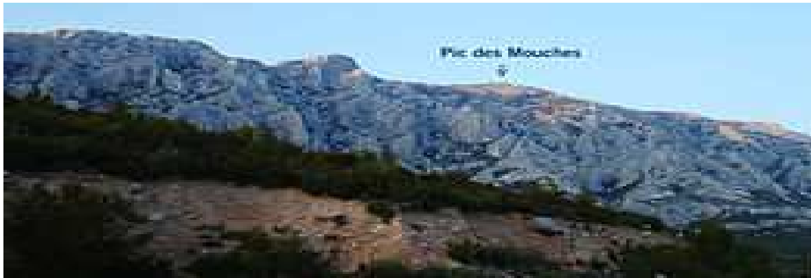
La Sainte Victoire et le Pic des Mouches.

Son point culminant s'appelle le pic des mouches , près du village de Puyloubier . Avec une altitude de 1011 mètres il s'agit de l'un des plus hauts sommets du département des bouches du Rhône .