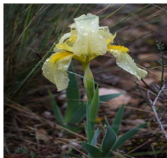
L'Iris Sauvage Appelé aussi l'iris des garrigues