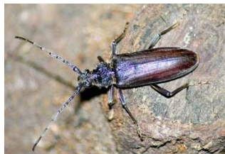
Le Grand Capricorne