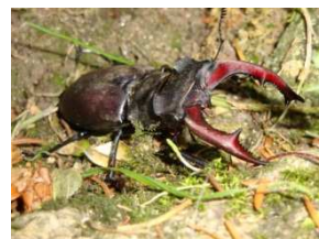
La Lucane cerf-Volant