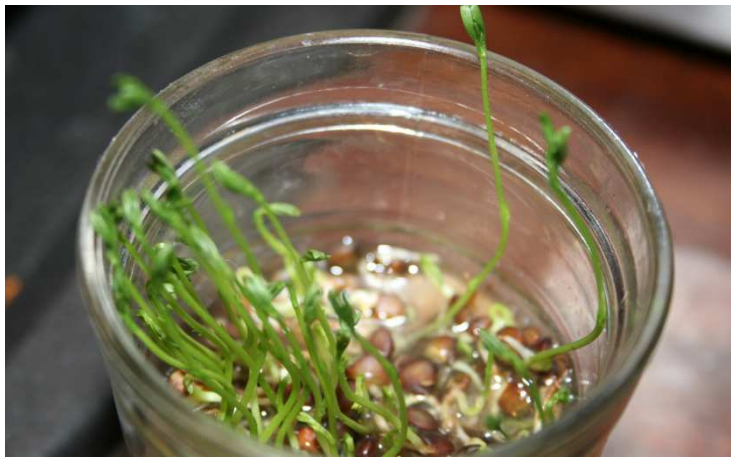
7 ème jour : le germe mesure 65 mm