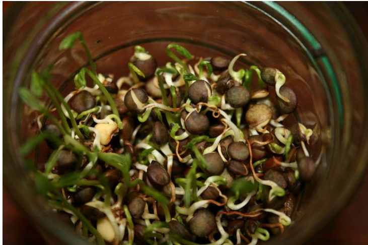
6 ème jour : le germe mesure 40 mm